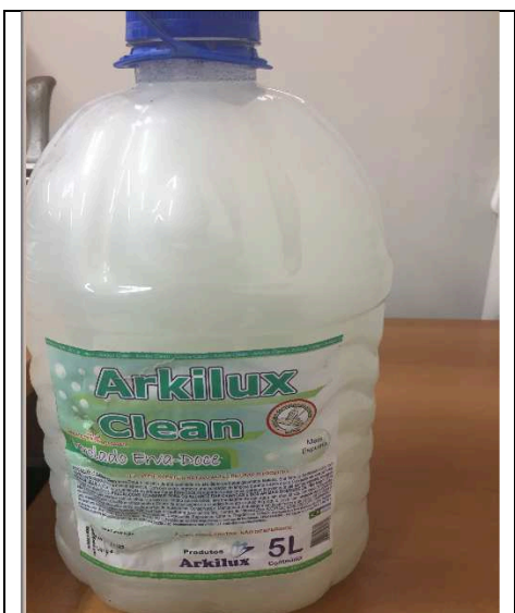
Imagem 01 – Produto

Sabonete cremoso, perolado, com alta eficiência limpadora, com ph neutro para não agredir à pele, formulado com matérias-primas cosméticas e sequestrantes, com elevada formação de espuma, consistência firme, biodegradável, com as seguintes propriedades físico-químicas: ph 100% - 6,0 a 7,00; fragrância: erva doce.