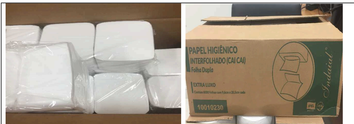
Imagem 01 – Embalagem e Produto

Papel higiênico interfolhado, folhas duplas, pré-cortados, produzido com 100% fibras virgem, não reciclado, a cor branca, liso, ultra macio, medindo 10 x 20 cm, de boa qualidade e resistência à tração. Embalagem primária: pacotes individuais transparentes com no mínimo 200 folhas e no máximo 250 folhas; embalagem secundária deve ser em caixas de papelão de boa qualidade e resistência (para melhor empilhamento, manuseio e conservação no depósito do almoxarifado). As caixas de papelão poderão conter de 2.000 a 8.000 folhas.