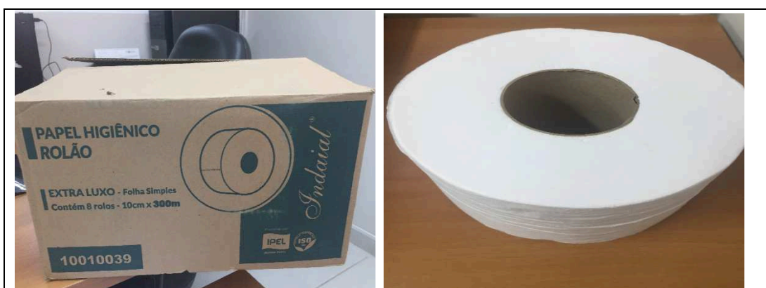
Imagem 01 – Embalagem e Produto

Papel higiênico tipo rolo, extra macio e absorvente, produzido com 100% fibras virgem, alta absorção, branco, resistência à tração (para evitar desperdícios), solúvel no meio aquoso, com rigoroso controle microbiológico, com as seguintes especificações: rolo com mínimo 300 metros, largura: 10 cm, folha Simples.