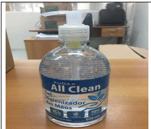
Imagem 01 – Embalagem e Produto

Álcool gel 70%; álcool etílico hidratado 70% inpm, anti-séptico, ação germicida e bactericida. Para higienização das mãos; embalagem plástica com válvula pump contendo aproximadamente 500 ml ou 440 gr.