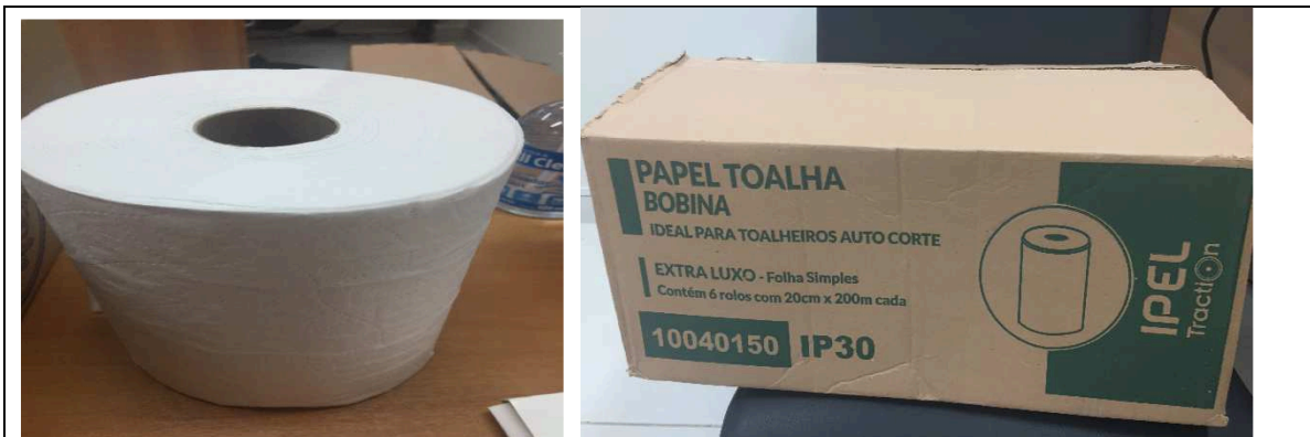
Imagem 01 – Embalagem e Produto

Papel toalha bobina com 200m de comprimento e 20cm de largura (diâmetro do rolo fechado o máximo 173mm).