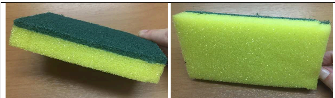
Imagem 01 – Produto

Esponja limpeza, material poliuretano e fibra têxtil, formato retangular, aplicação limpeza geral, características adicionais dupla face, comprimento mínimo 100 mm, largura mínima 70 mm, espessura mínima 20 mm.