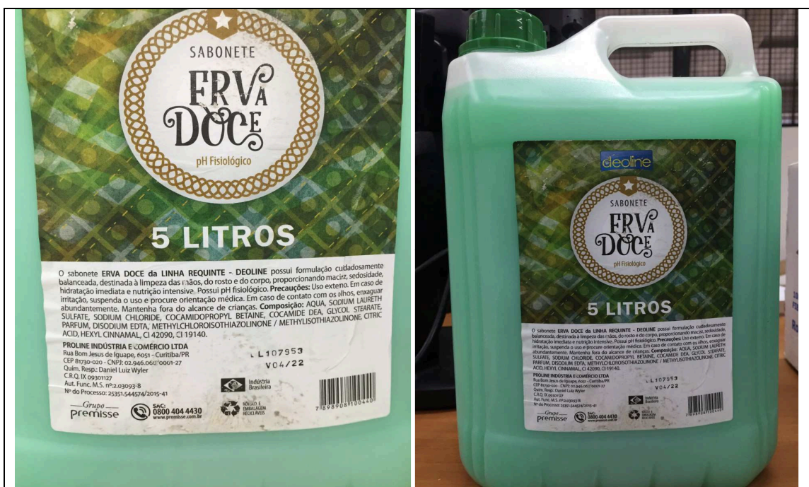
Imagem 01 – Embalagem e Produto

O sabonete apresentado possui a cor verde, com fragrância: erva doce; estando em desconformidade com o especificado em Edital, que exige a cor perolado, com fragrância: erva doce.