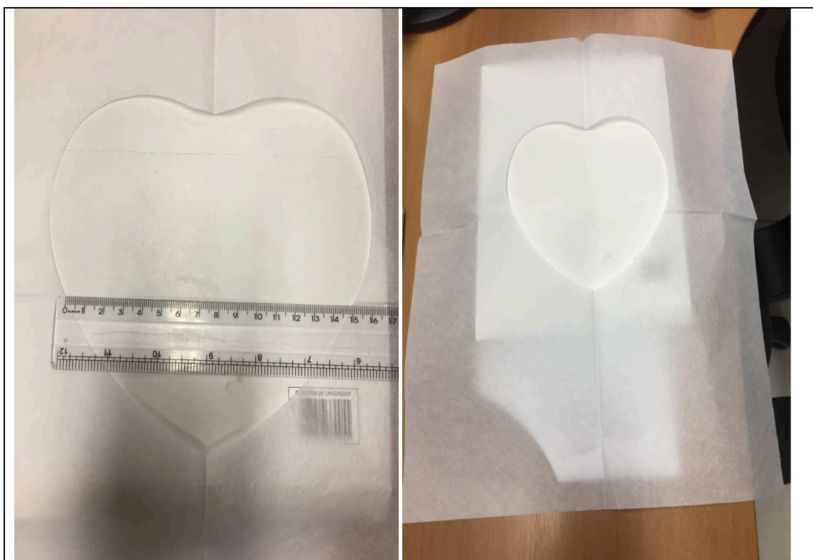
Imagem 02 – Papel Protetor

2.2 Papel Protetor: Desagregável em água, cor branca.