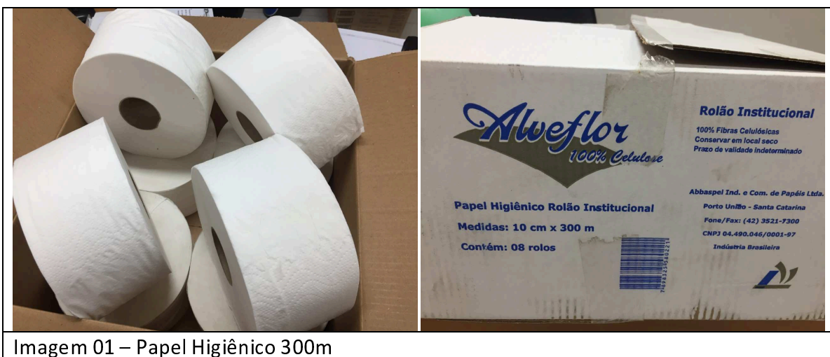
Imagem 01 – Papel Higiênico 300m

O produto foi entregue e apresentado conforme registro fotográfico abaixo, atendendo a todas as especificações exigidas pelo Edital.