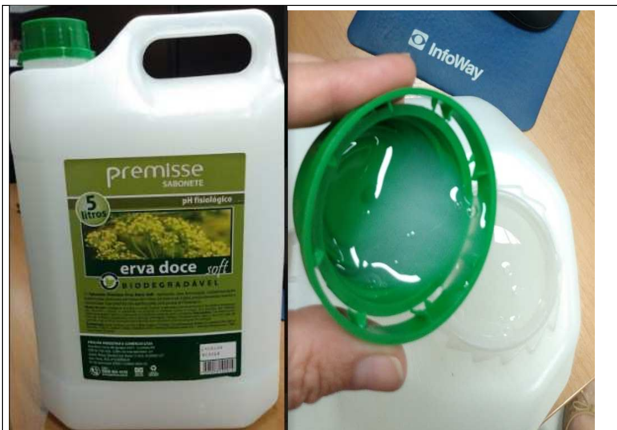
Imagem 01 – Embalagem e Produto

Sabonete de textura cremosa e perolada, com alto nível de formação espumosa, apresentando PH fisiológico (entre 5,5 – 6,5), e não neutro (entre 6 a 7). A viscosidade conforme análise da ficha técnica também está em desconformidade com o especificado em Edital.