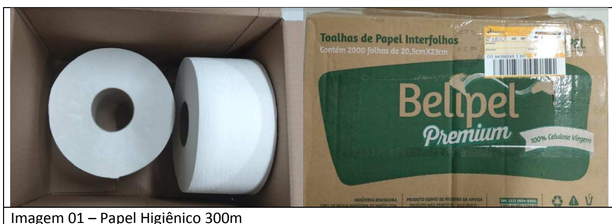
Imagem 01 – Papel Higiênico 300m

O produto foi entregue e apresentado conforme relato fotográfico abaixo, fora de sua embalagem original , não restando certeza de se tratar do mesmo produto apresentado na proposta, inviabilizando assim a análise da especificação e demais itens como: material utilizado na fabricação, marca, acondicionamento, já que o próprio produto, em si, não traz essas características. Com base na análise descrita, conclui-se que a amostra está em desconformidade.