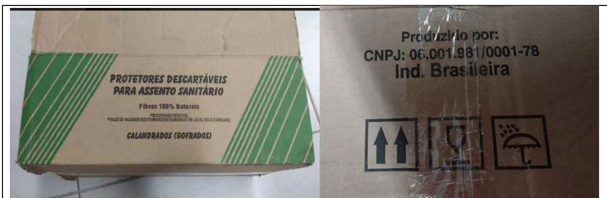
Imagem 01- Embalagem secundária

Primando pelo princípio da razoabilidade e proporcionalidade, a margem de diferença da medida cima apontada, não traz prejuízos consideráveis e nem impacta na utilização do produto, sendo este Núcleo favorável à aprovação.