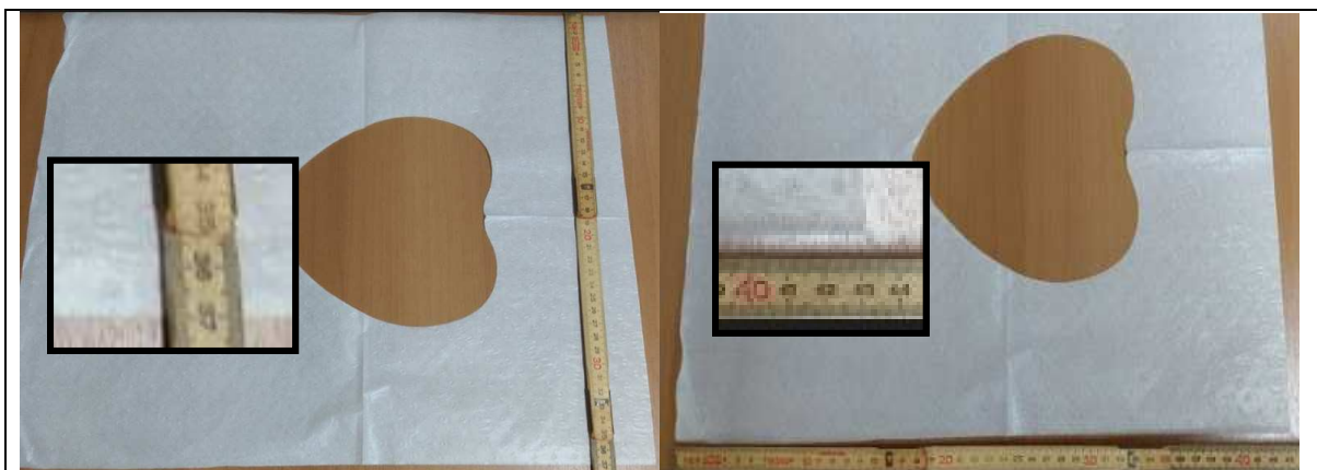
Imagem 03 – Papel protetor

Núcleo de Almoarifado e Patrimônio - NAP