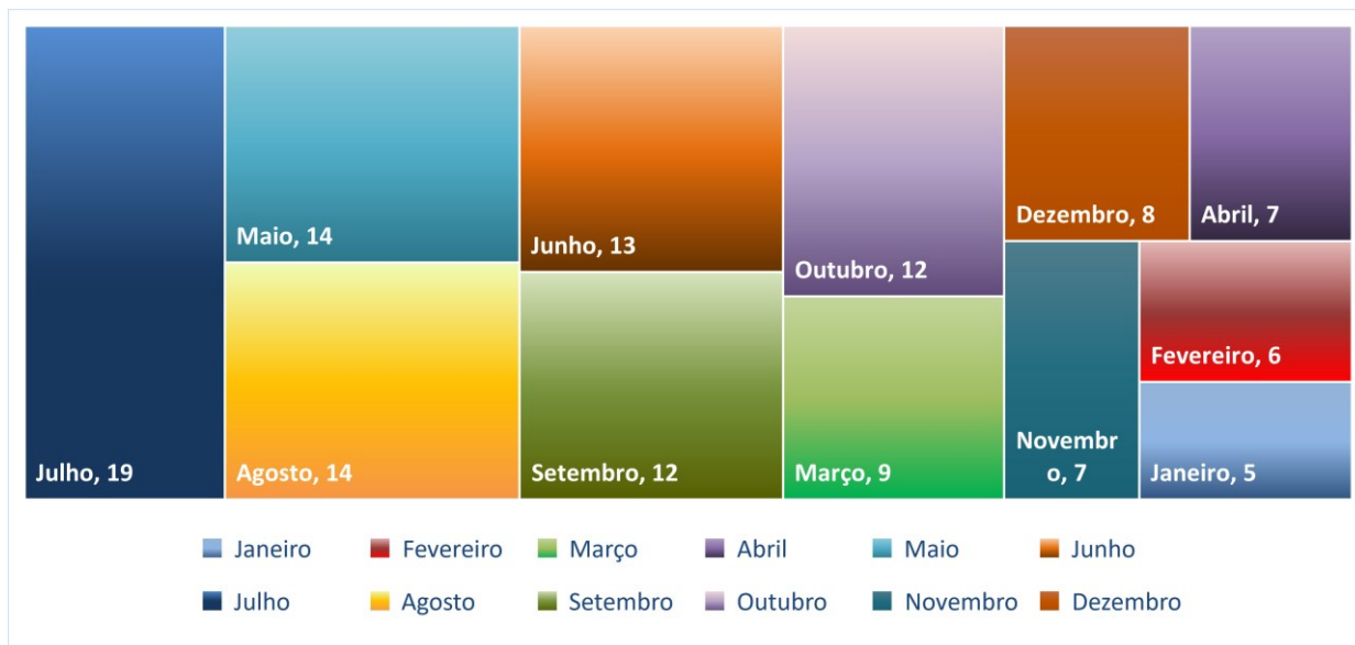
Gráfico 1 - Distribuição das demandas por mês de instrução

Do total de demandas constantes do PCA 2026, cerca de 28,00% (vinte e oito por cento) são prorrogações contratuais, ou seja, 35 demandas consolidadas.