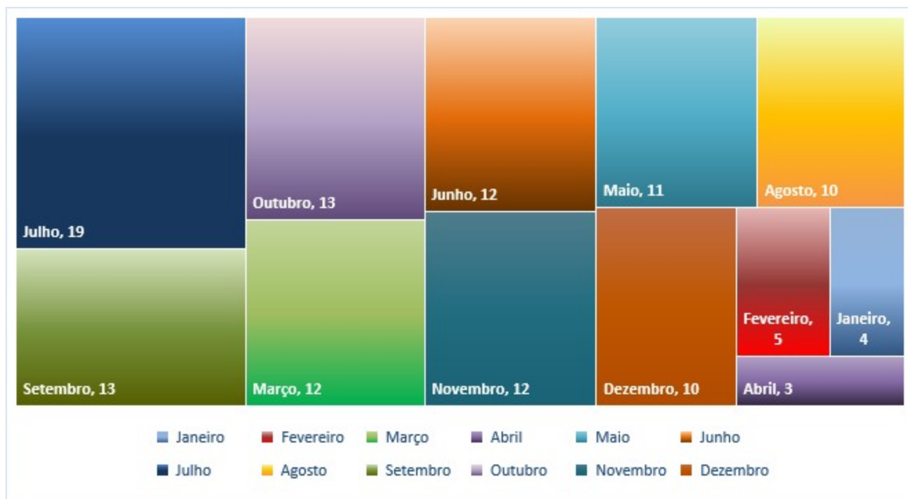
Gráfico 1 - Distribuição das demandas por mês de instrução 1

O gráfico a seguir apresenta o número de demandas por mês de instrução para o PCA-2024, incluídas as prorrogações contratuais e renovações automáticas.