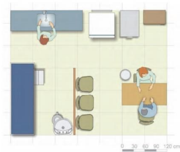
Figura 31. Leiaute de sala de imunização.