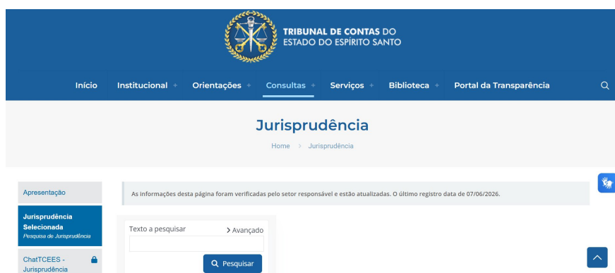
Tela inicial da ferramenta

Ao acessar a página de Jurisprudência do TCEES, a ferramenta é carregada automaticamente. O campo " Texto a pesquisar " fica visível no centro da tela, ao lado do botão Pesquisar e do link Avançado .