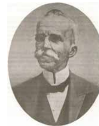
Rui Barbosa, Patrono dos Tribunais de Contas do Brasil

ao comentar a Constituição de 1946, Tomo III, 4 ed. 1963, disse: "vê-se que não seria, o Marquês, contrário à criação de um Tribunal de Contas, desde que fosse convencido de sua eficácia". A ideia da criação ficou apenas em projeto. Em 1845, nova tentativa, agora de Manoel Alves Branco, encampada por Pimenta Bueno, Silveira Martins e João Alfredo. Mais uma vez a ideia não logrou êxito. Em 1890, com Ruy Barbosa liderando a ideia da criação de um Tribunal de Contas, veio o Decreto nº 966-A. Mas, o passo decisivo só foi no ano seguinte, 1891, quando a Constituição da República, no artigo 89, das Disposições Gerais, prescreve: - "Art. 89 - É instituído um Tribunal de Contas para liquidar as contas da receita e despesa e verificar a sua legalidade, antes de serem prestadas ao Congresso. Os membros deste Tribunal serão nomeados pelo Presidente da República, com a aprovação do Senado e somente perderão os seus lugares por sentença. É verdade que a Constituição de 1891 dedicou um único artigo ao Tribunal de Contas, mas a de 16 de junho de 1934 destinou-lhe a Seção II, do Capítulo VI, colocando-o em posição destacada e de relevo na hierarquia da administração Nacional. Por sua vez, a Constituição de 10/10/1937 instituiu um Tribunal de Contas com competência para acompanhar, diretamente ou por delegação, a execução orçamentária, bem como julgar as contas dos responsáveis por bens e dinheiros públicos e da legalidade dos contratos firmados pela União".