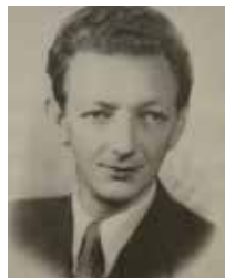
Argêo Reginaldo Lorenzoni 1959